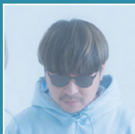
オリジナルブランド 「0867」