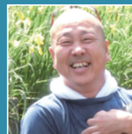
岡山県教育庁高校教育課 高校魅力化推進室室長