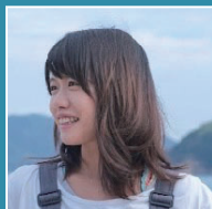
フリースクール育海 副代表

真庭市の市外局番をデザインコンセプトに掲げたオリジナルブランド「0867」を展開し、カルチャーにスポットを当てたコンテンツを発信し続けるなど県内外を問わず精力的に活動。