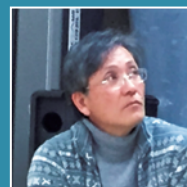
岡山県立真庭高等学校 マイスターハイスクールCEO

岡山県教育庁高校教育課高校魅力化推進室 室長。2000年に矢掛商業高校にて環境教育を始め、学校設定教科「やかげ学」を開設。矢掛中学校、岡山後楽館高校を経て、岡山県教育庁に入庁。高校と地域の連携や高校の魅力づくりを支援。